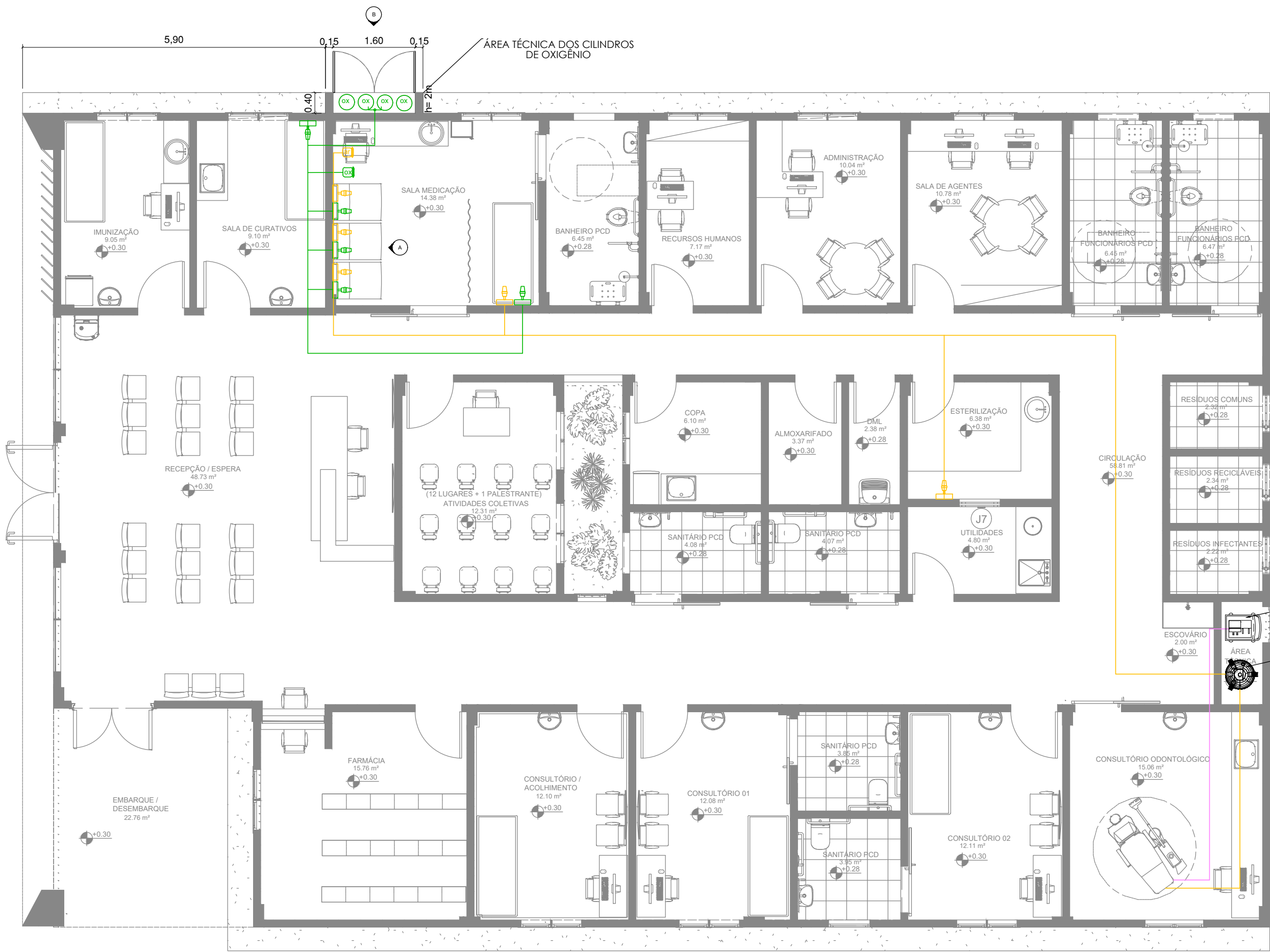
PLANTA BAIXA - PONTOS DE GASES MEDICINAIS ESC. 1/75